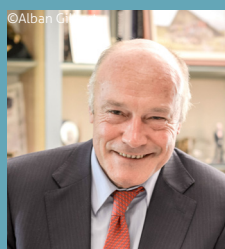
Alain ROUSSET Président de la Région Nouvelle-Aquitaine

Pour aller encore plus loin, nous souhaitons, avec la Région Nouvelle-Aquitaine, reprendre la propriété des ouvrages aujourd'hui détenus par l'Etat. La CACG et BRL, qui gère le réseau hydraulique à l'Est de la région et dont nous sommes propriétaires, sont les bras armés de la Région, et des autres collectivités, pour une gestion hydraulique fine. A terme, je souhaite que l'ensemble des infrastructures gérées par la CACG et BRL constitue un Réseau Hydraulique Régional (RHR) exemplaire, intégrant l'ensemble des enjeux de la transition écologique et énergétique (gestion durable et partagée de l'eau, énergies renouvelables, agroécologie, préservation de la biodiversité...) sur le territoire d'Occitanie.»