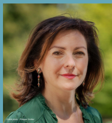
Carole DELGA Présidente de la Région Occitanie

« Depuis plus de 60 ans, la CACG est un acteur incontournable de l'eau. Partenaire majeur des territoires, son action permet un partage équitable de cette ressource grâce notamment à la gestion des aménagements et des ouvrages hydrauliques.